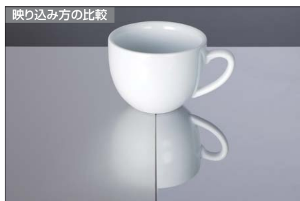
サテンヘアライン 鏡面